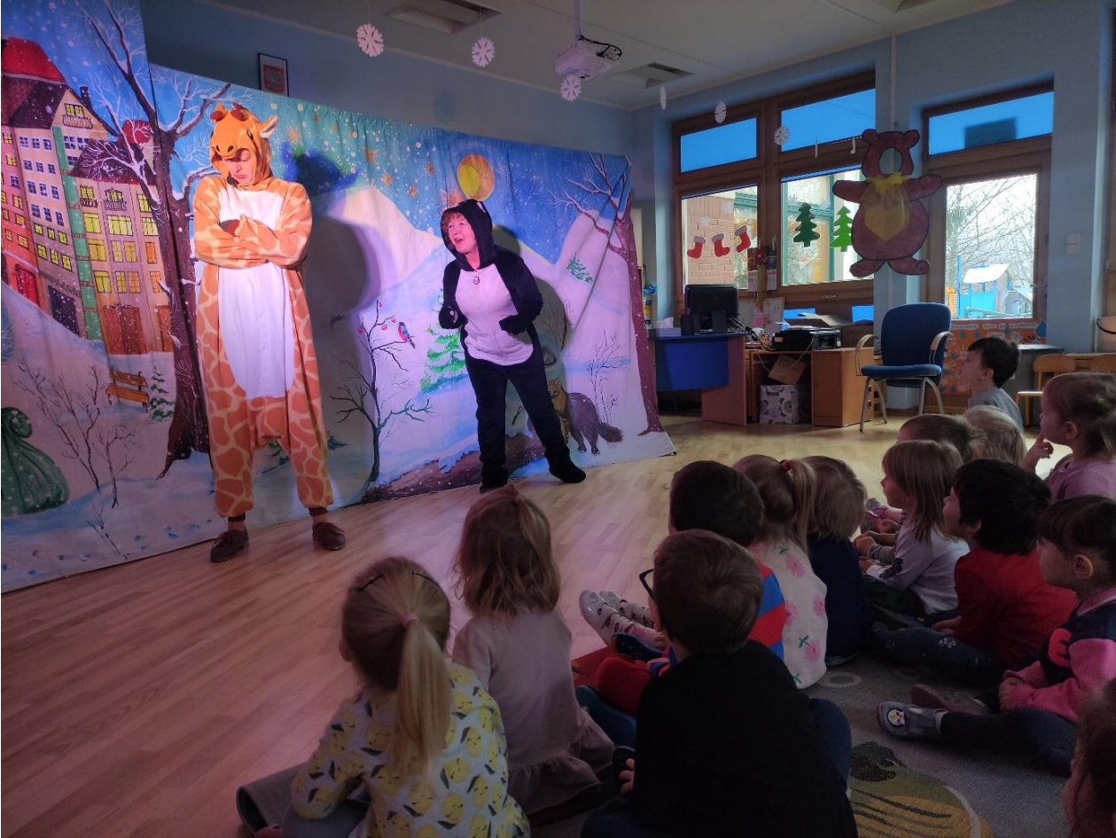
Przedstawienie teatralne pt. „Magiczny płatek śniegu”.