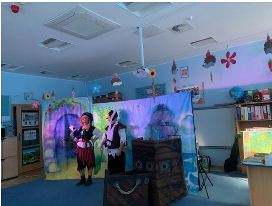
Andrzejki w Motylków

Z dużym zainteresowaniem oglądaliśmy również przedstawienie teatralne w wykonaniu aktorów.